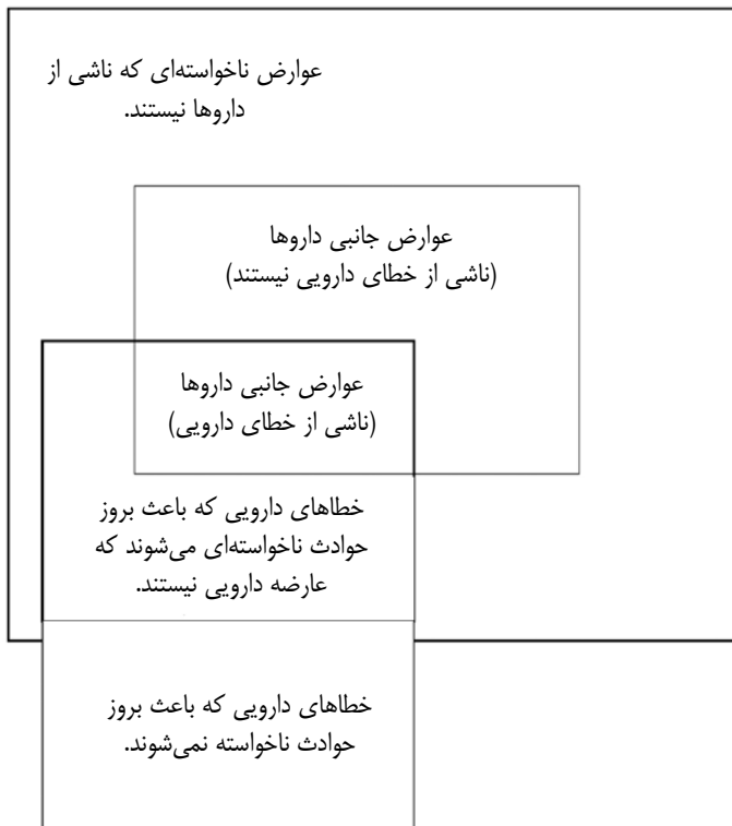
شکل ۲ - دیاگرام ون

برای توانایی افتراق بین عوارض جانبی داروها و خطاهای دارویی ابتدا باید به ارتباط این دو با هم پی‌برد. در این زمینه دیاگرامی به نام دیاگرام ون ۲ وجود دارد که ارتباط و جایگاه این دو دسته مهم را نسبت به هم مشخص می‌کند (شکل ۲). خطاهای دارویی را هم‌چنین براساس موقعیت ۳ ، چگونگی بروز ۴ و سایکولوژی تقسیم‌بندی می‌کنند. دسته‌بندی براساس موقعیت وابسته به زمان، مکان، داروها و افراد خاص حاضر در آن موقعیت هستند. دسته‌بندی براساس چگونگی